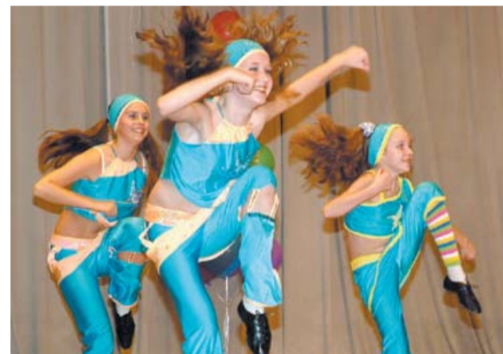
На сцене образцовый танцевальный коллектив «Зоренька».

Школа № 21 — одна из самых крупных в городе. Она находится в промышленном районе, удаленном от учреждений культуры и спорта, поэтому стала для многих жителей микрорайона центром спортивной и культурной жизни. Школа оборудована двумя компьютерными кабинетами, двумя спортивными залами, тиром, хореографическим и тренажерным залами. СОШ предоставляет ученикам и их родителям право выбора: в начальной школе реализуются три программы, на старшей ступени — обучение в рамках информационного профиля.