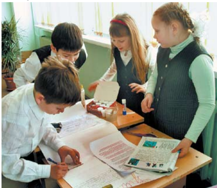
Гимназисты работают над научным проектом.