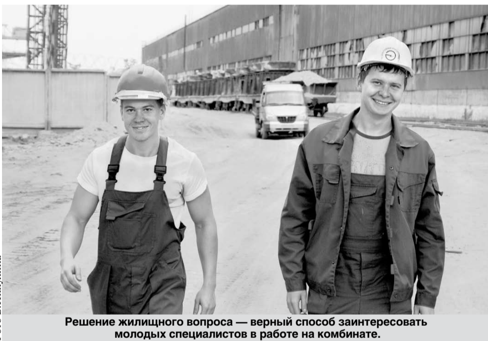
Решение жилищного вопроса — верный способ заинтересовать молодых специалистов в работе на комбинате.